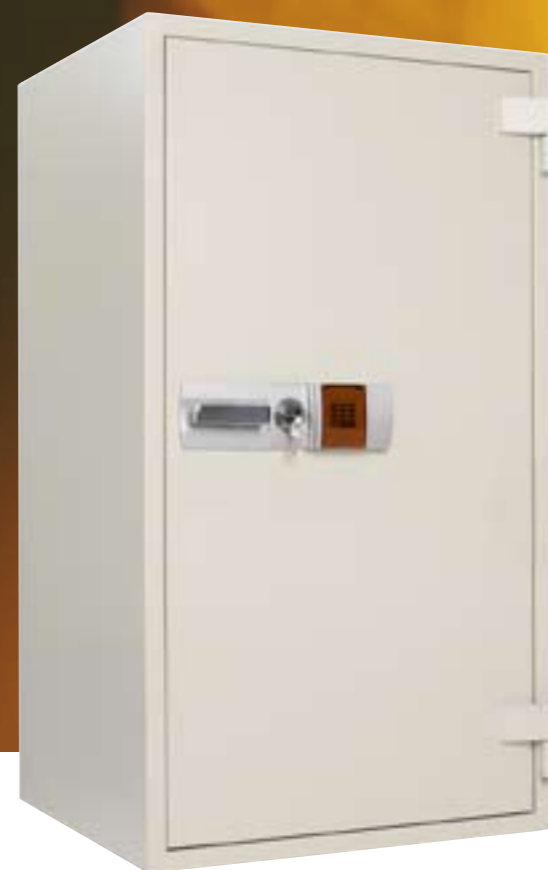
Modell DS 133E Art. nr. 71017 Kapasitet: 16 ringpermer 278 liter. 382 kg. Brannklasse 120P Elektronisk kodelås Utvendig hxbxd: 1255x750x719mm Innvendig mål hxbxd: 1050x570x465mm