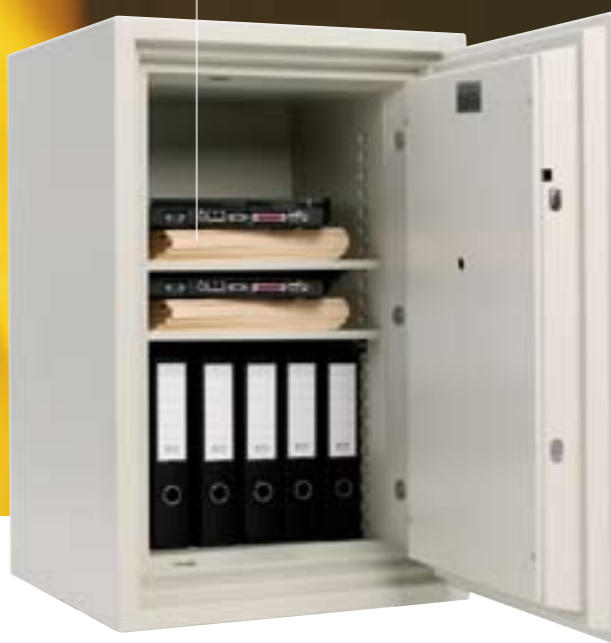
Modell DS 100E Art. nr. 71016 Kapasitet: 10 ringpermer 121 liter. 244 kg. Brannklasse 120P Elektronisk kodelås Utvendig hxbxd: 945x610x630mm Innvendig mål hxbxd: 750x430x376mm