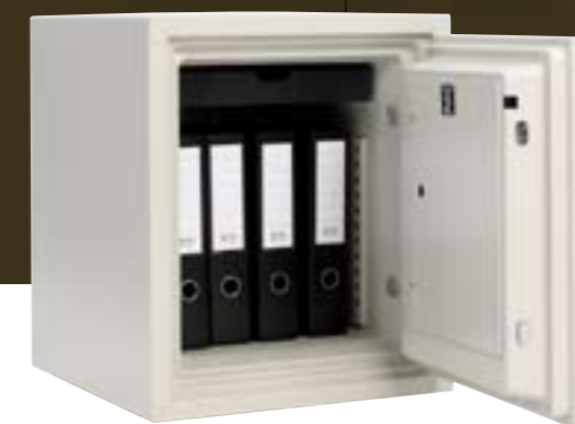
Modell ESD 104 A Art. nr. 71015 Kapasitet: 4 ringpermer 40 liter. 73 kg. Brannklasse 60P Elektronisk kodelås Utvendig hxbxd: 506x435x502mm Innvendig mål hxbxd: 386x315x325mm