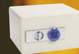
Modell DS 23EH Art. nr. 71012 11 liter. 29 kg. Brannklasse 60P Elektronisk kodelås Utvendig hxbxd: 249x444x352mm Innvendig mål hxbxd: 144x379x224mm

Dokumentskapene egner seg f.eks. til sikring av kontrakter, tegninger og andre verdipapirer.