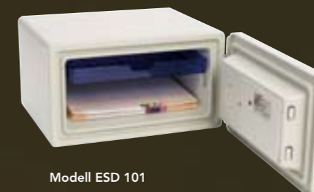
Modell ESD 101 Art. nr. 71013 17 liter. 30 kg. Brannklasse 60P Elektronisk kodelås Utvendig hxbxd: 307x412x362mm Innvendig mål hxbxd: 230x335x224mm