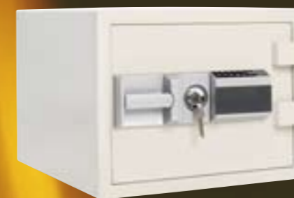
Modell ESD 103 Art. nr. 71014 22 liter. 51 kg. Brannklasse 60P Elektronisk kodelås Utvendig hxbxd: 346x486x420mm Innvendig mål hxbxd: 226x366x260mm