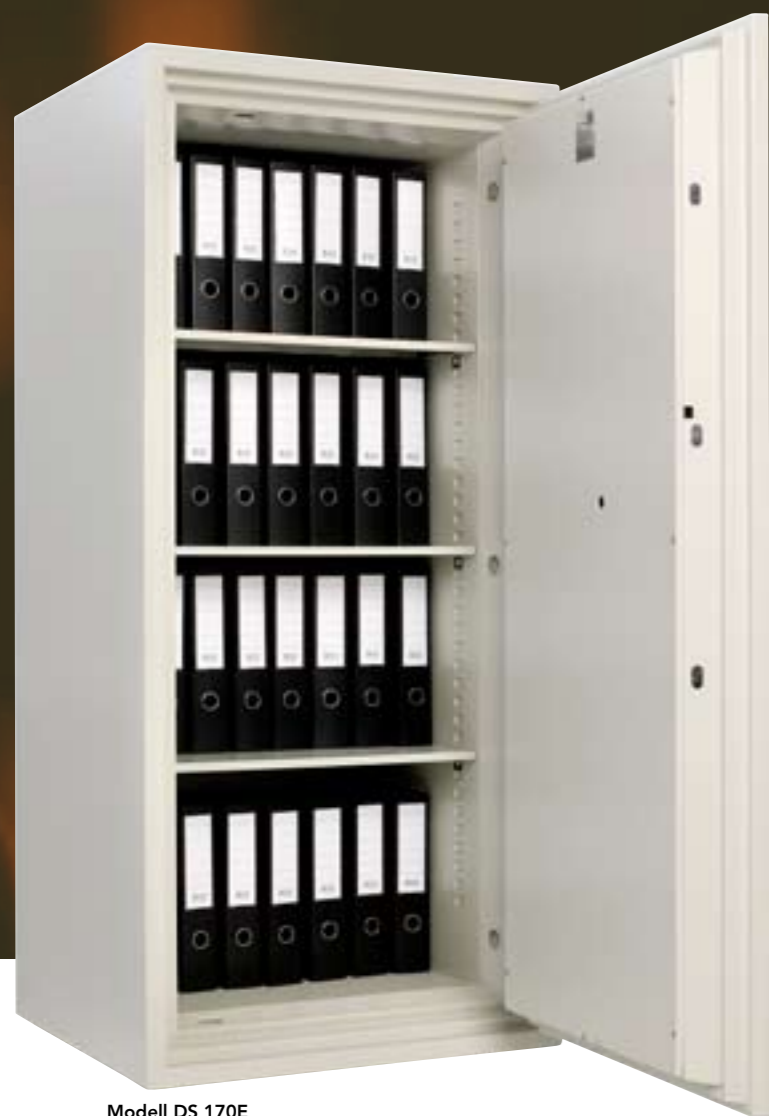
Modell DS 170E Art. nr. 71018 Kapasitet: 24 ringpermer 384 liter. 500 kg. Brannklasse 60P Elektronisk kodelås Utvendig hxbxd: 1655x750x719mm Innvendig mål hxbxd: 1450x570x465mm

Disse brannsikre dokumentskapene tilfredsstill alle normale krav til kontor- og hjemmebruk, og er testet og sertifisert ihht NT Fire017 med godkjenning etter en 1 eller 2 timers branntest (60P hhv 120P). Testene og sertifiseringen er gjennomført ved anerkjente Sveriges prøvnings- og forskningsinstitutt (SP), noe som gir trygghet for kvaliteten på testene. Standardfarge er gråhvit RAL 9002.