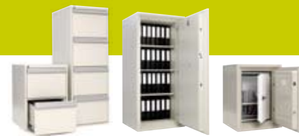
Brannsikre arkivskap, dokumentskap og datamediaskap

Velkommen til Sarpsborg Metall AS – din leverandør av garderobe-, arkiv- og oppbevaringsløsninger. Vi er en moderne og proaktiv bedrift med over 60 års erfaring i bransjen. Gjennom egendesign og produksjon tilbyr vi et meget variert og fleksibelt produktspekter med smarte detaljer og brukervennlige løsninger. Vi håper du vil finne våre produkter interessante og at du kontakter oss dersom du skulle ha spørsmål. Vårt salg er basert på tillit, og vi vil derfor gjøre vårt ytterste for at du som kunde skal kunne få den vare og service du forventer.