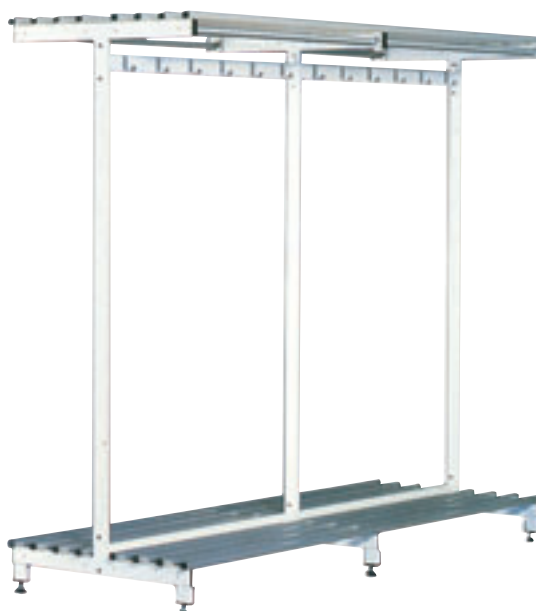
Modell: 2-sidig. Høyde 177 cm, dybde 71 cm. Art. nr. 60 001