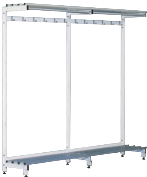
Modell: 1-sidig. Høyde 177 cm, dybde 38 cm. Art. nr. 60 006