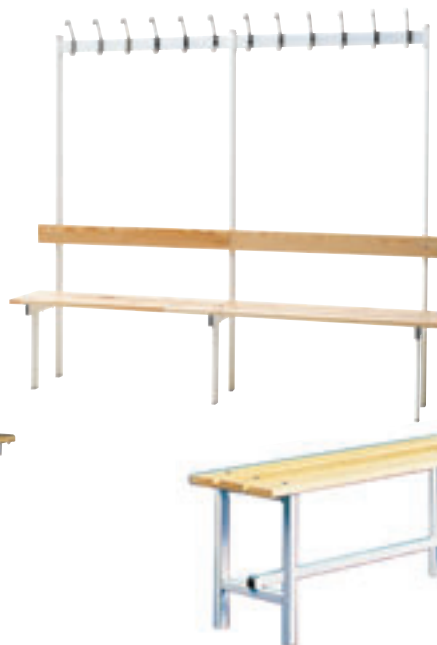
Frittstående sittebenk. Høyde 43 cm, dybde 32 cm. Lengder 110 og 200 cm.