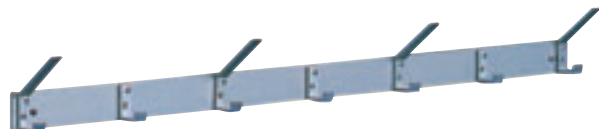
Korte og lange kroker.