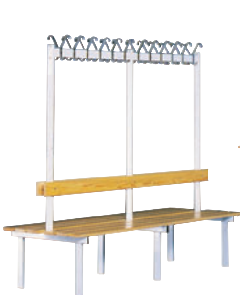
Garderobestativ med sittebenk, 2-sidig utførelse. Dybde 71 cm. Lengder 110 og 200 cm. Høyde 180 cm. Lakkerte furubord.