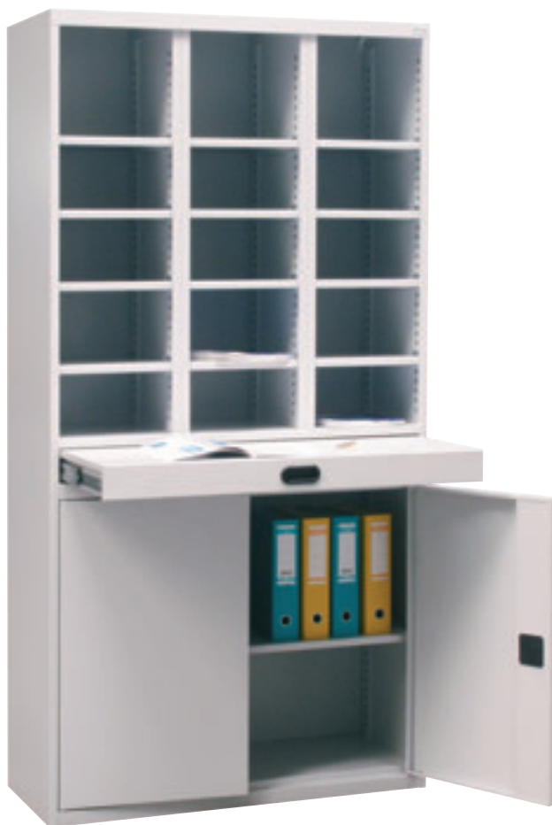
Art. nr: 70 341

Fremfor alt, skapene er robuste og kan leveres i flere farger uten pristillegg, se fargekart på nest siste side. Reol for postsortering kan tilpasses ethvert behov da hyllene kan flyttes i trinn på 25 mm. Løse hyller kan bestilles ekstra ved behov.