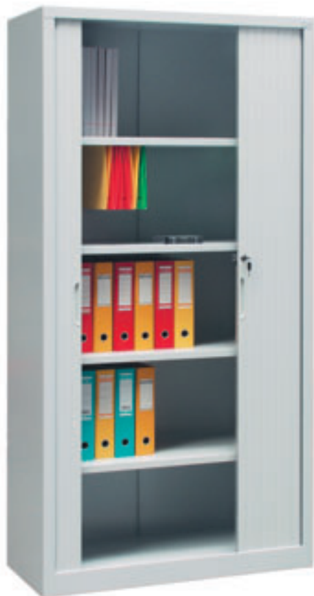
Art. nr: 70 274

Eksempel på standard innredninger i kontorskap.