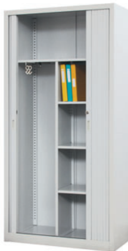
Art. nr: 70 337