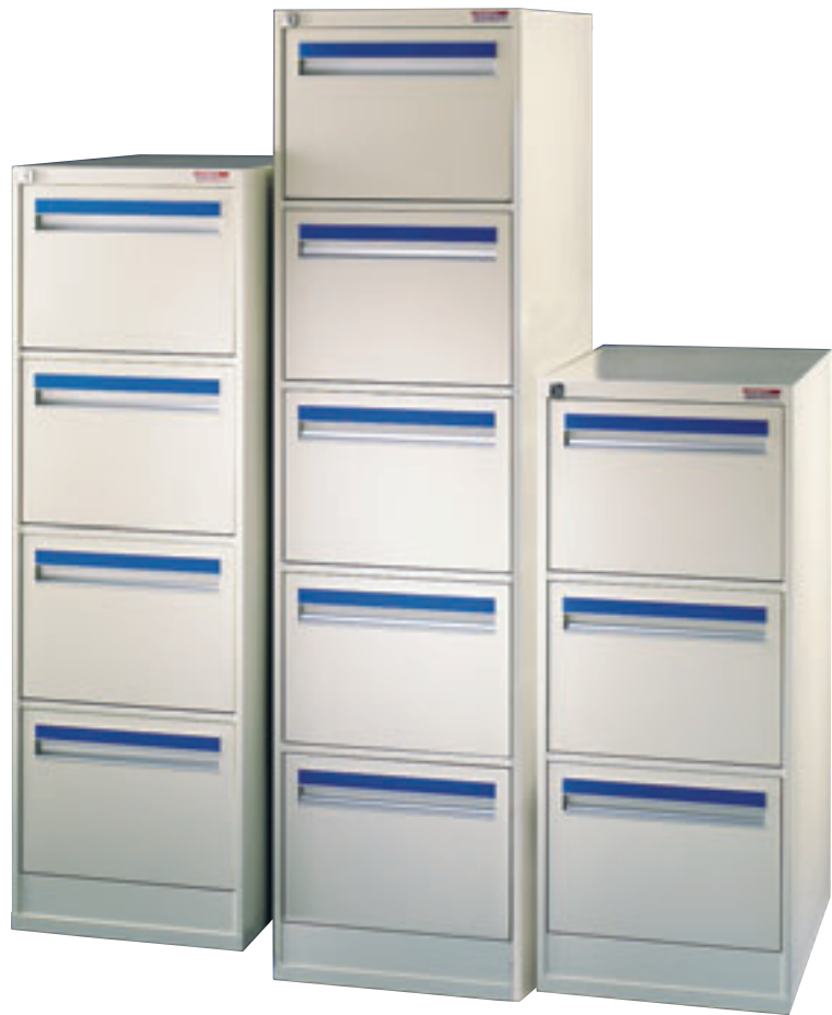
Norske arkivskap. Dybde 720 mm.

Norske skap er produsert i pulverlakkert stål med galvaniserte plater i bunnen.