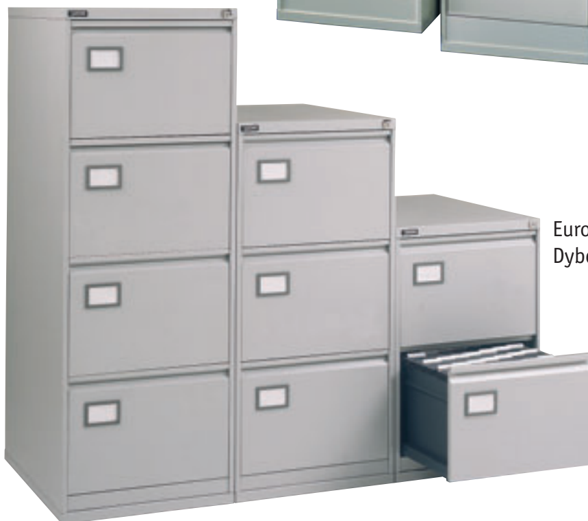
Euro arkivskap. Dybde 620 mm.