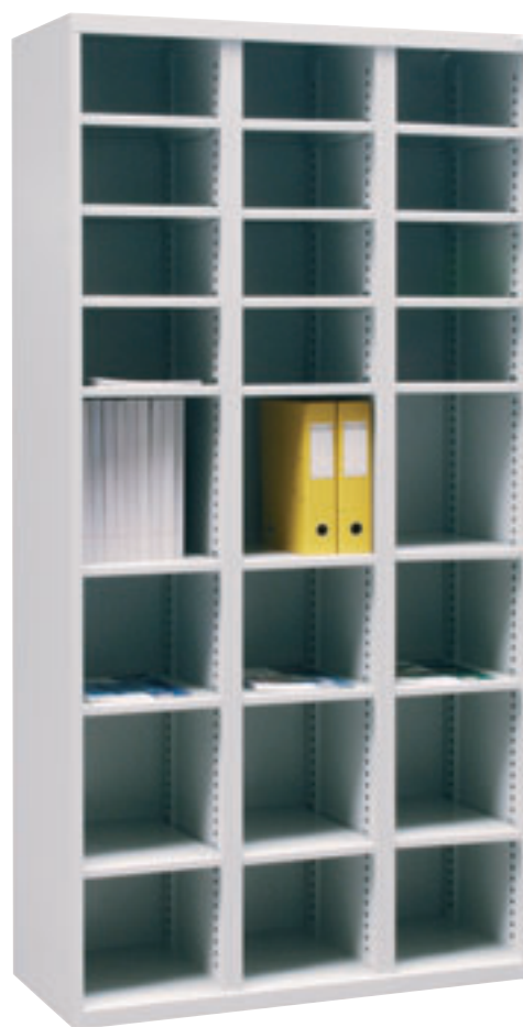
Art. nr: 70 342

Kontorskap med postsortering i 15 rom. Hyllene er justerbare. Uttrekkbar avlastningshylle. Underskap med 1 justerbar hylle.